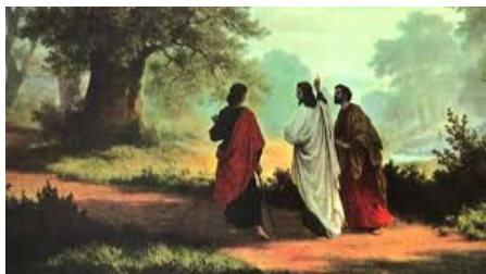
Załącznik 1 a